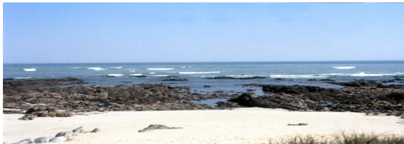
Figuur 5: Rotskus by Struisbaai waar die Schoonenberg gestrand het (Foto: Jimmy Herbert, Somerset-Wes, 2012)

“met packe en zakke” met die boot en op vlotte na die wal gevlug en die boot op die strand laat lê, terwyl Van Soest en van sy offisiere nog op die skip was.