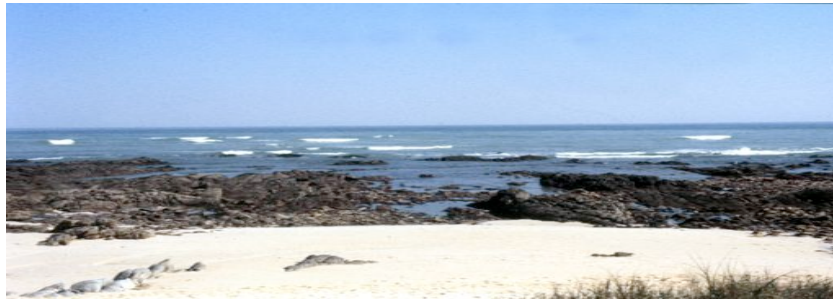
Figuur 5: Rotskus by Struisbaai waar die Schoonenberg gestrand het

“met packe en zakke” met die boot en op vlotte na die wal gevlug en die boot op die strand laat lê, terwyl Van Soest en van sy offisiere nog op die skip was.