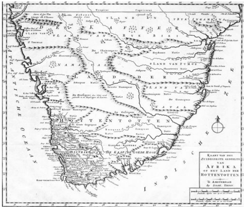
Figuur 2: Kaart van suidelike Afrika, omstreeks 1730, opgestel deur Isaak Tirion, Amsterdam

Van Soest en die skippers van sewe ander skepe op pad na Batavia is by die Politieke Raad se vergadering van 28 April 1722 deur Goewerneur Mauritz de Chavonnes beveel om sover doenlik saam te vaar. 12 Daar was berigte van seerowery in die Ooste, en hulle sou die belange van die Kompanjie die beste dien deur op hulle vaart kontak met mekaar te behou. Op 10 Mei het hulle Tafelbaai verlaat en op 21 Julie in Batavia aangekom.