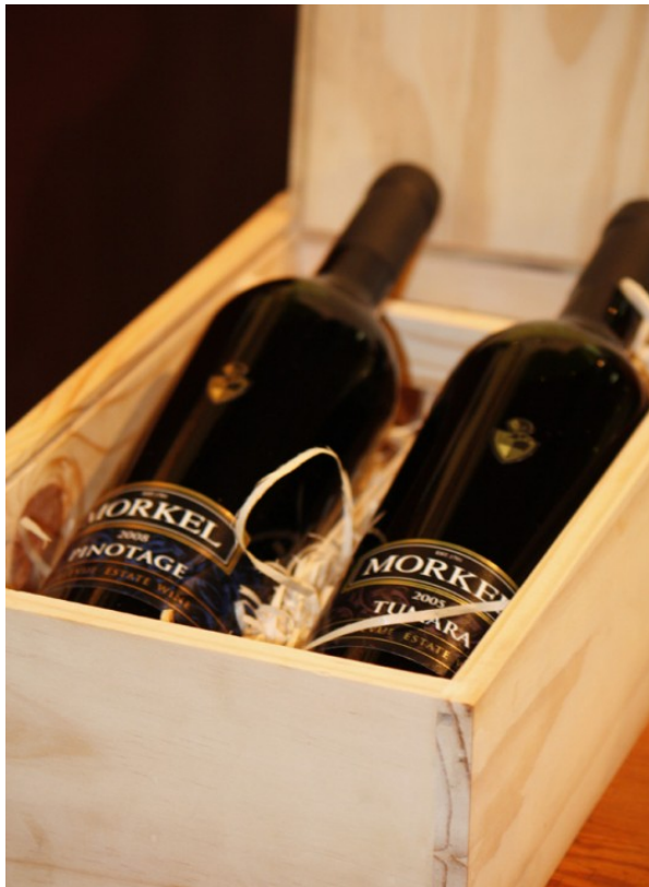
Morkel Wines from Bellevue Estate

As far as I am aware, the older generations produced wine of indifferent quality delivered in bulk to merchants and later to the K.W.V. This was a government sponsored wine cooperative established in 1918 to bring order into the production and marketing of wine and to improve quality. Good table wines came during the late 20 th century following years of research and development into vine growing and wine making.