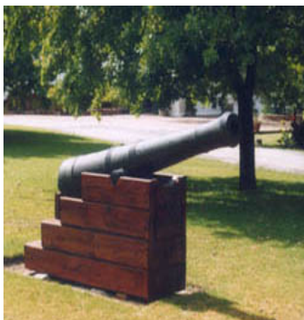
Historic Signal Cannon