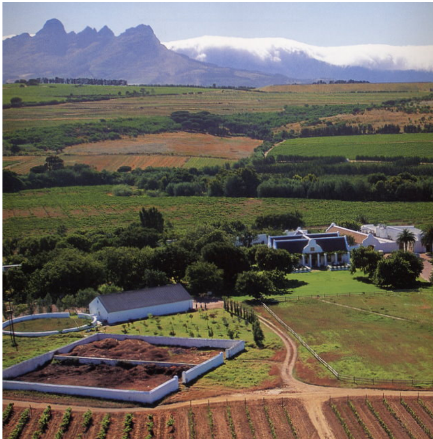
Meerlust. Cloud covered Hottentots Holland Mountains in the background