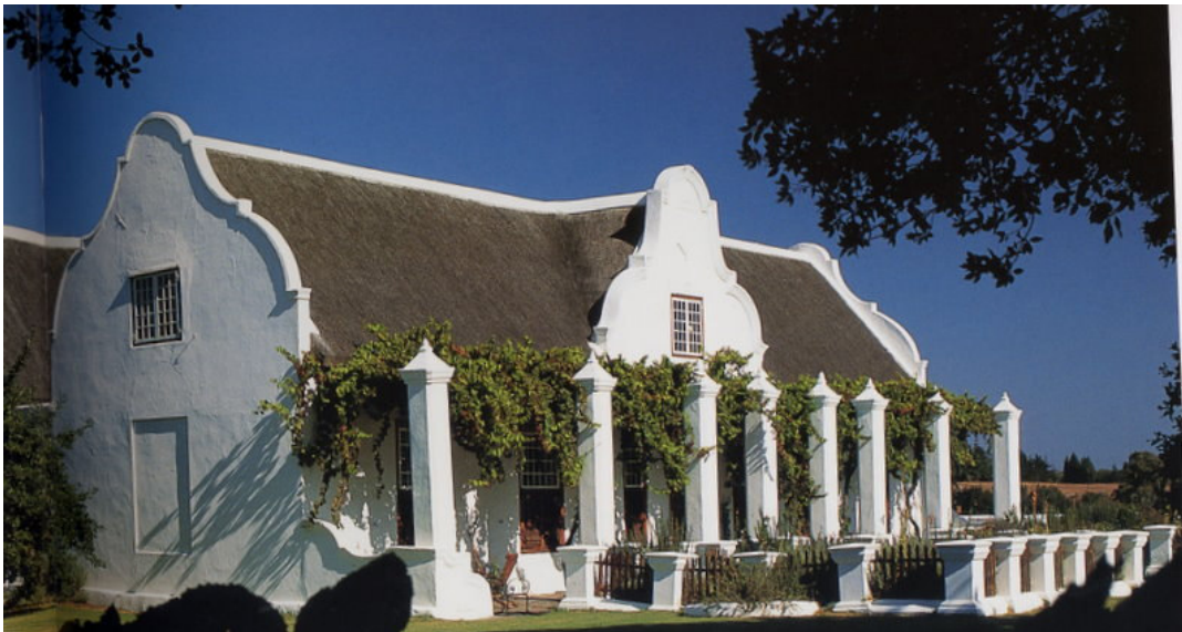
Meerlust. Nicely restored

Meerlust with its beautiful Cape Dutch gables has remained in the Myburgh family and has been beautifully restored and, while still a working farm, has become a lovely museum and tourist attraction.